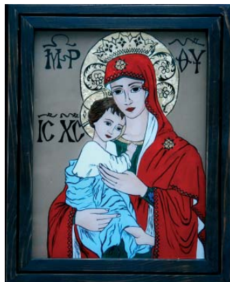
Foto: Maica Domnului cu Pruncul Iisus

Într-una din lunile trecute am rugat-o să ne împărtășească câte ceva despre ea și despre meșteșugul ei.