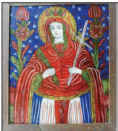
Foto: Sfânta Cuvioasă Parascheva