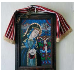
Foto: Plângerea Maicii Domnului cu chindeu

În mod normal, înainte de a picta o icoană este nevoie de post și rugăciune – nu reușesc întotdeauna să le fac atât cât îmi doresc, însă încerc să postesc cât de mult pot. De obicei încep cu o rugăciune – există una specială pentru pictorii de icoane. Nu pictez dacă sunt supărată sau agitată și nici în gălăgie. Pictez la lumina zilei și foarte rar la lumină artificială. În timp ce pictez ascult muzică psaltică, de obicei acatisul sfântului pe care îl pictez, ascult radio Trinitas ori las televizorul pe TV Trinitas pentru că au emisiuni interesante. Câteodată, în timp ce pictez, mai ascult cărți audio. Îmi petrec foarte mult timp la masa de pictură, așa că încerc să recuperez lipsa timpului pentru citit cu cărțile audio.