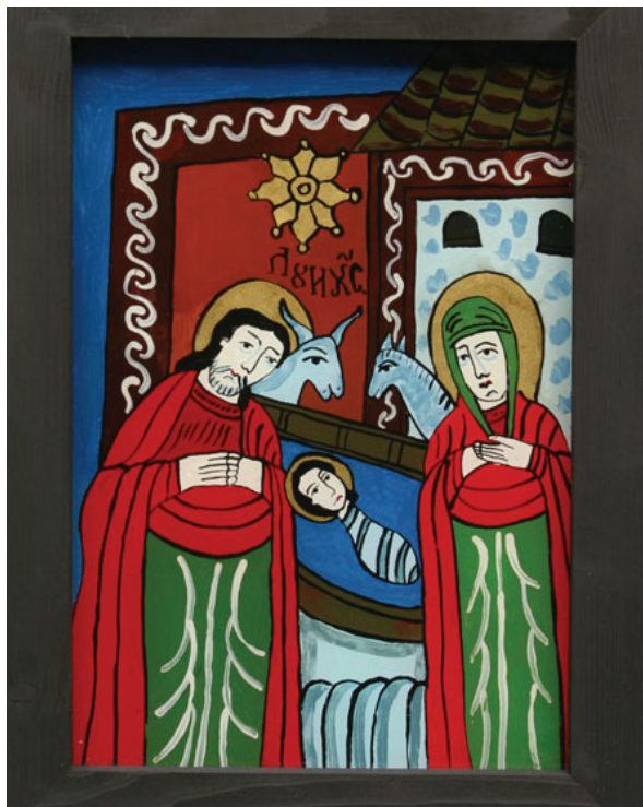
Nașterea Domnului - icoană pe sticlă, Carmen Indergand Bira