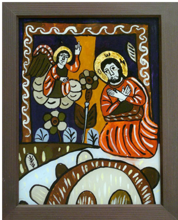
Iisus în Grădina Ghetsimani – icoană pe sticlă de Carmen Indergand-Bira