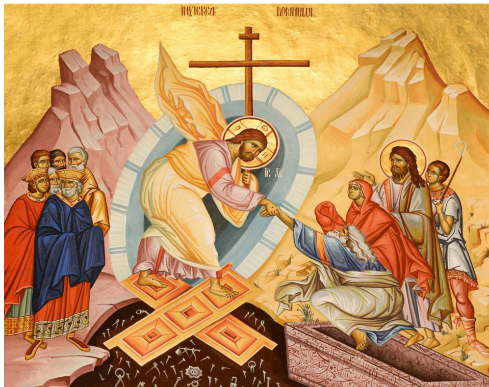
Învierea Domnului

pentru noi punctul culminant al nădejzii noastre, al credinței noastre, al iubirii noastre față de Dumnezeu. Noi știm că Hristos este Calea, Adevărul și Viața noastră. El a înviat și a biruit moartea, pentru ca și noi să avem viață veșnică, împreună cu El.