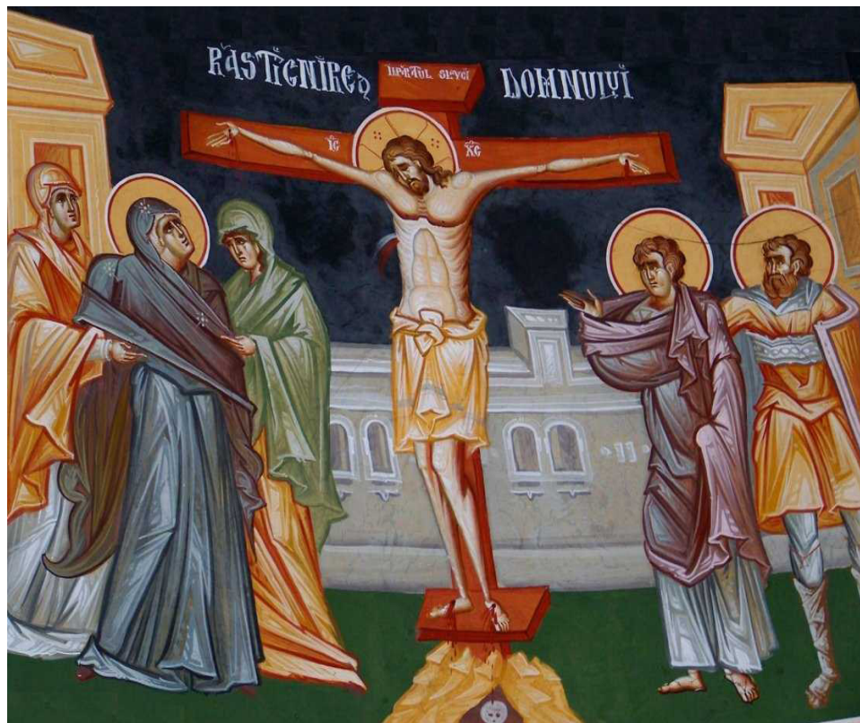
Răstignirea Domnului

toate de frumusețea omului, făcut după chipul și asemănarea Sa.