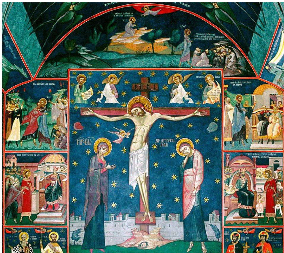
Răstignirea - preluare www.doxologia.ro

De la acest strigăt al Lui pe Cruce, nu mai este singurătate pentru cel care Îl cheamă pe nume, precum El, chemându-L în fața morții pe Tatăl, L-a apropiat pentru veșnicie de noi, cei care de fapt L-am părăsit.