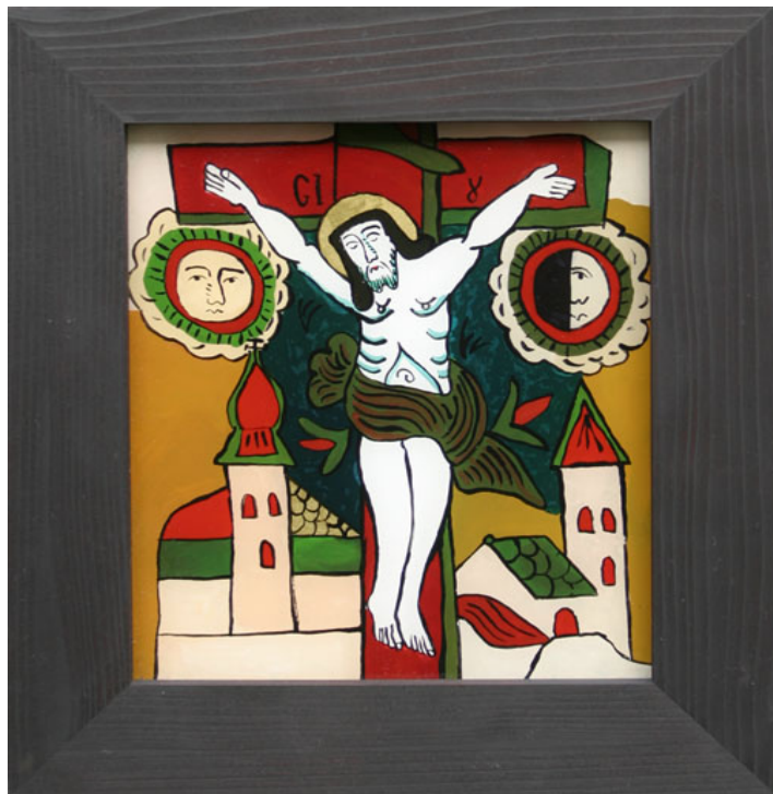
Iisus pe Cruce - icoană pe sticlă, Carmen Indergand Bira