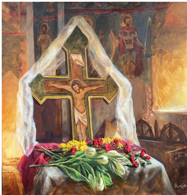
Epitaf, Irina Poloni